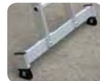
Abb. Best.-Nr. 22416