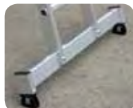
Abb. Best.-Nr. 21314