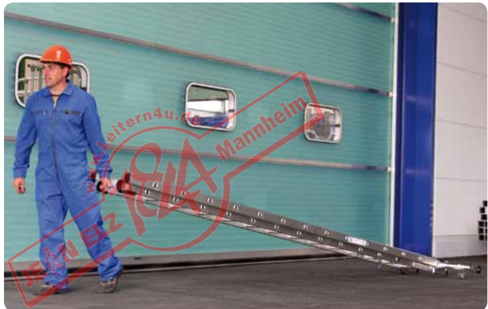
Abb. Best.-Nr. 21414