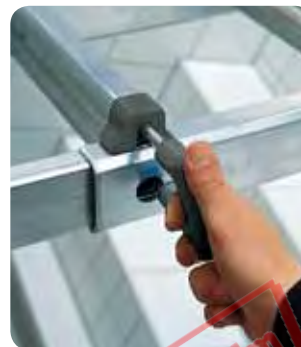
Abb. Best.-Nr. 32021