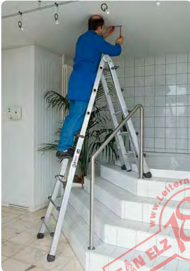
Abb. Best.-Nr. 32017