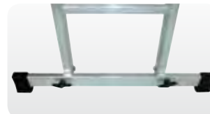
Abb. Anbauset Best.-Nr. 32022