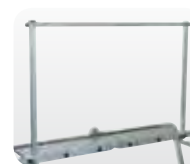
Abb. Best.-Nr. 30305 und Best.-Nr. 30303