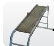
Abb. Best.-Nr. 30303