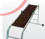
Abb. Best.-Nr. 30300