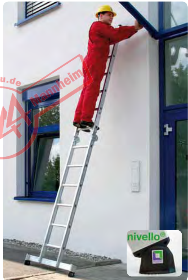
Abb. Best.-Nr. 32212