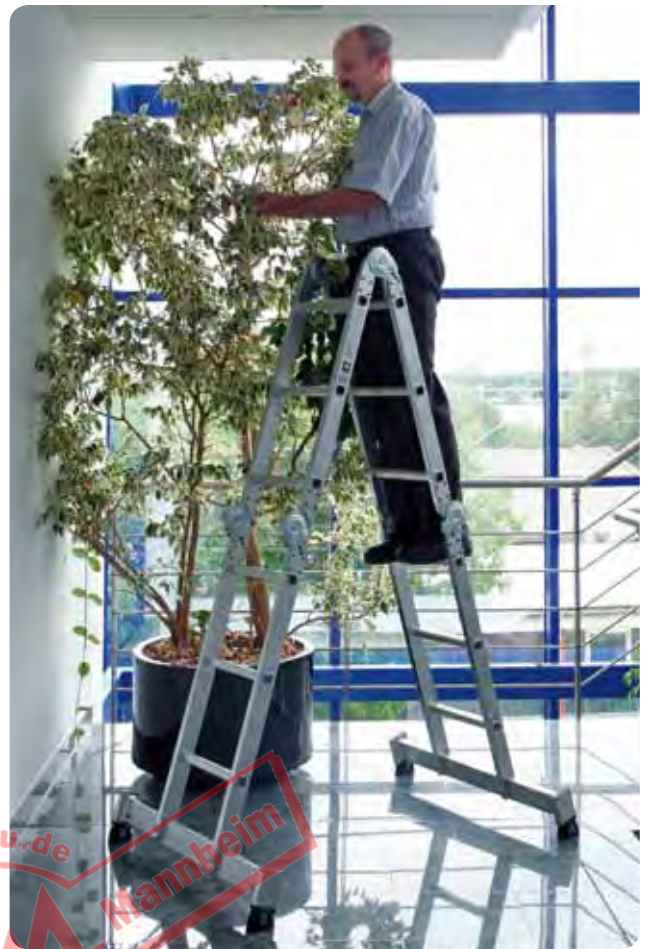
Abb. Best.-Nr. 31312