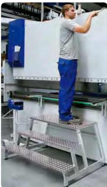
Abb. Best.-Nr. 50093