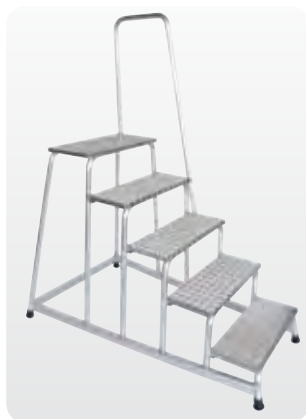
Abb. Best.-Nr. 50045