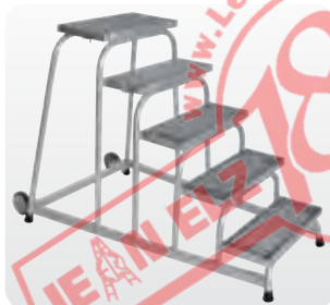
Abb. Best.-Nr. 51021