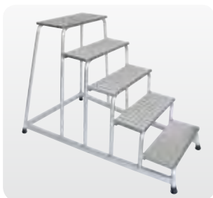
Abb. Best.-Nr. 50035