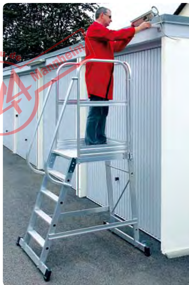
Abb. Best.-Nr. 303105

*4-stufige Ausführung mit einer Quertraverse.