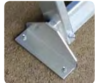
Fußwinkel zur Bodenbefestigung.