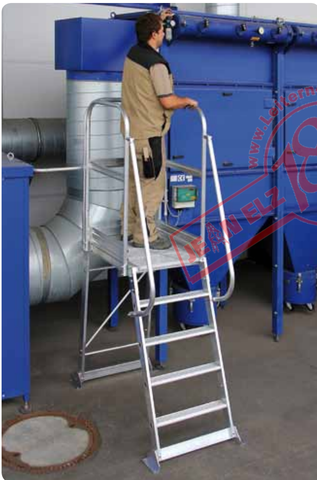
Abb. Best.-Nr. 303305

Versand erfolgt in Baugruppen zum einfachen Zusammenbau; Anleitung liegt bei.