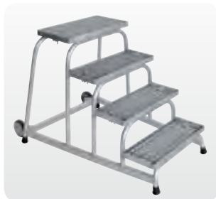
Abb. Best.-Nr. 51020