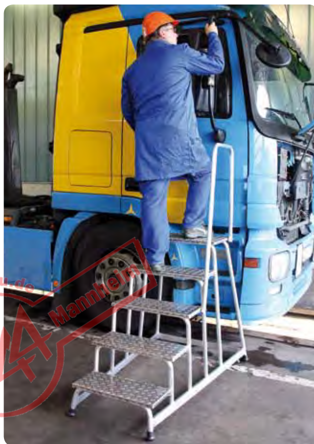
Abb. Best.-Nr. 50045