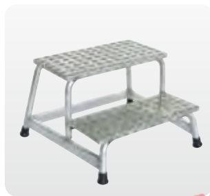
Abb. Best.-Nr. 50008