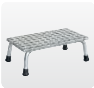
Abb. Best.-Nr. 50031