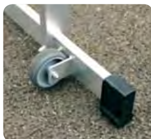
Quertraverse mit Rollen