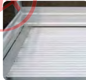
Große Plattform, 800 mm lang, 600 mm breit.