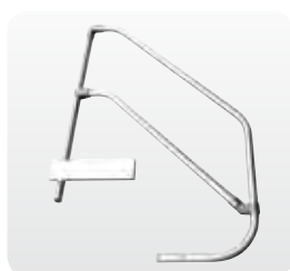
Abb. Best.-Nr. 50025