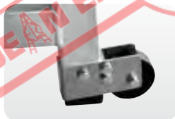
Abb. Best.-Nr. 50408