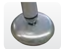
Abb. Best.-Nr. 50042