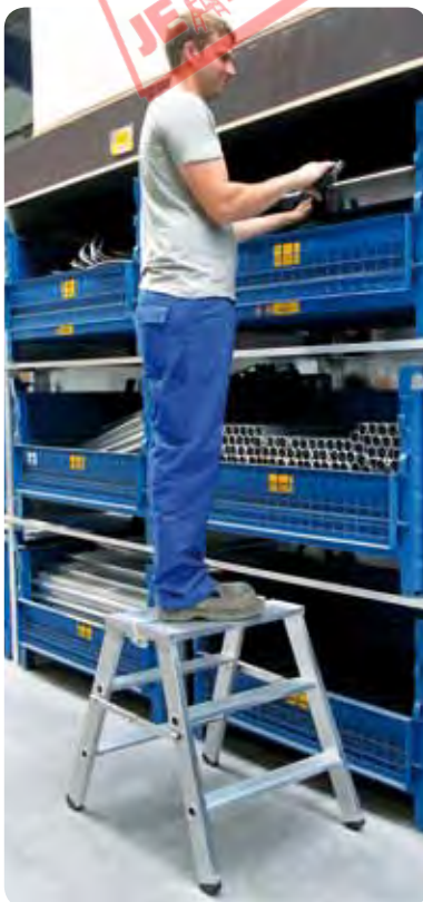
Abb. Best.-Nr. 50095