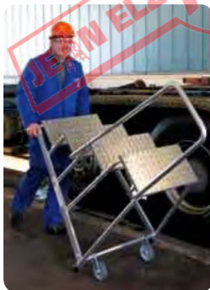
Abb. Best.-Nr. 50044 mit 50041