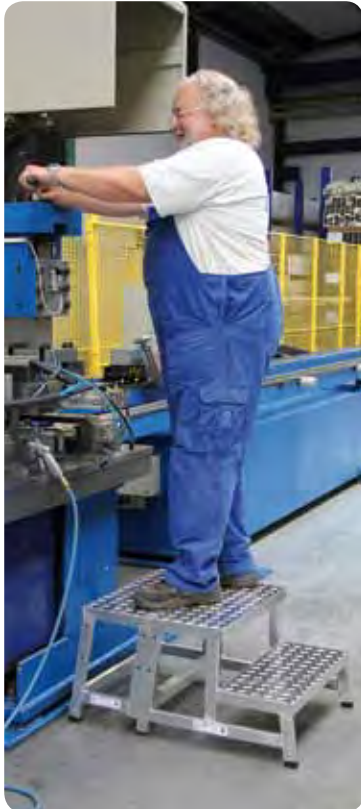
Abb. Best.-Nr. 50400 mit Best.-Nr. 50401