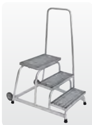
Abb. Best.-Nr. 51023