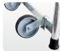
Abb. Best.-Nr. 50041