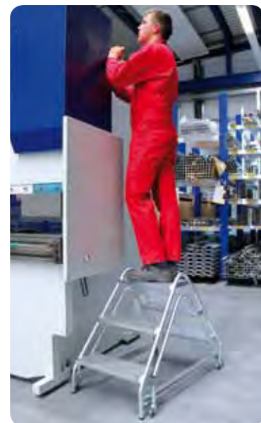
Abb. Best.-Nr. 50060 mit 4 St. Feder-Bremsrollen, Best.-Nr. 50069