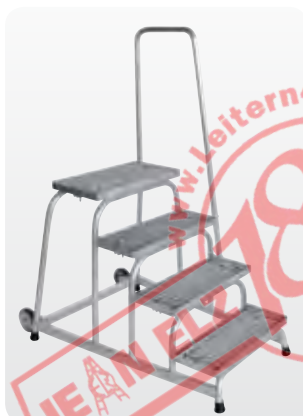
Abb. Best.-Nr. 51024