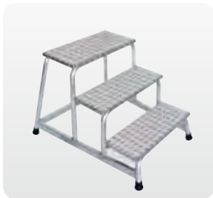
Abb. Best.-Nr. 50009