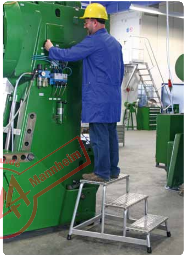
Abb. Best.-Nr. 50009