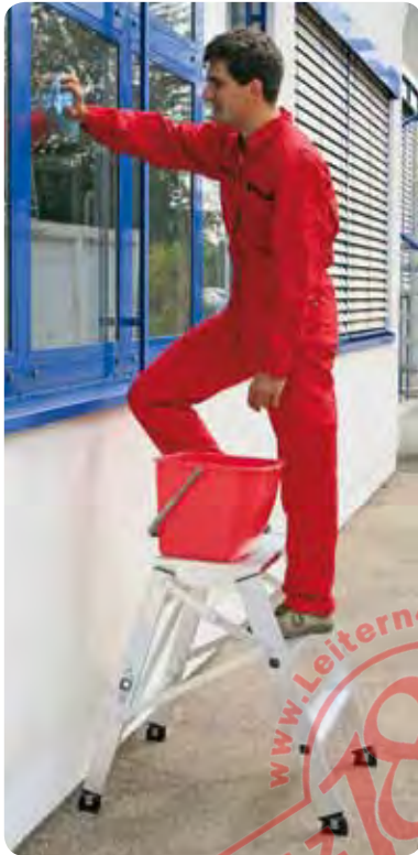
Abb. Best.-Nr. 50006