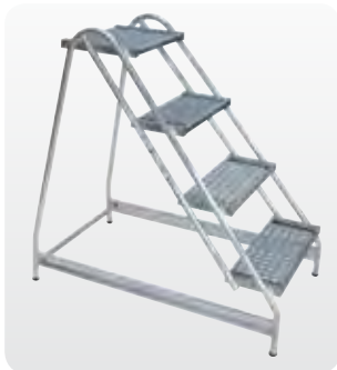
Abb. Best.-Nr. 50055