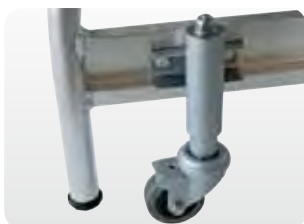
Abb. Best.-Nr. 50068/50069