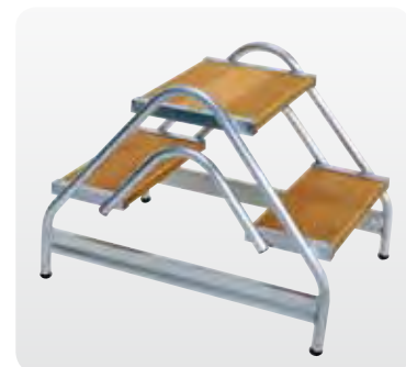
Abb. Best.-Nr. 50065