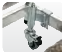
Abb. Best.-Nr. 50036