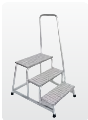
Abb. Best.-Nr. 50043