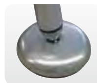
Abb. Best.-Nr. 50042