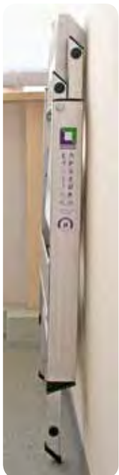
Abb. Best.-Nr. 55003