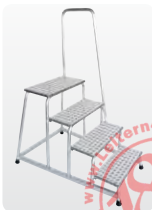
Abb. Best.-Nr. 50044