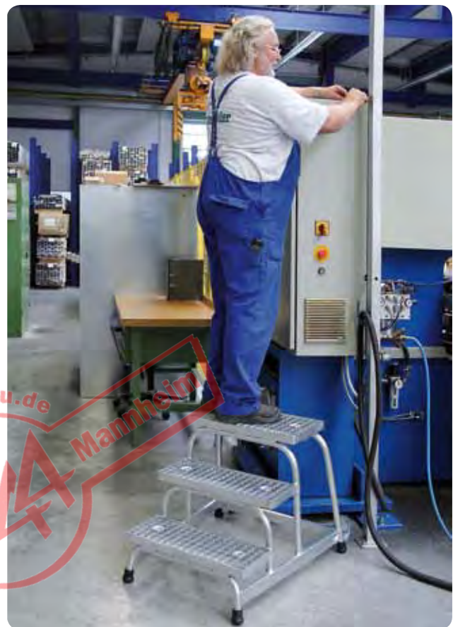
Abb. Best.-Nr. 51019