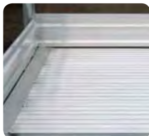
Große Plattform, 800 mm lang, 600 mm breit.

Versand erfolgt in Baugruppen zum einfachen Zusammenbau; Anleitung liegt bei.