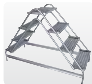
Abb. Best.-Nr. 50064