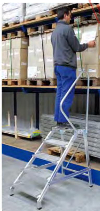
Abb. Best.-Nr. 50181