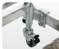
Abb. Best.-Nr. 50036