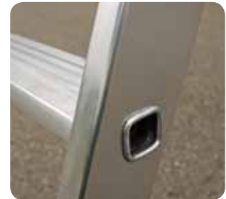
Gebördelte Stufen, 80 mm tief.