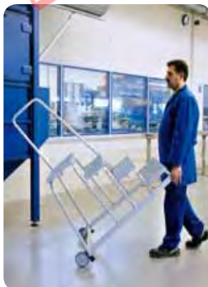
Abb. Best.-Nr. 51024