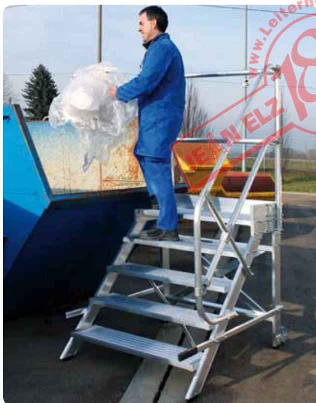
Abb. Best.-Nr. 50022 mit 50026 und 50029