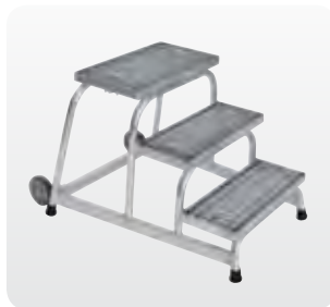
Abb. Best.-Nr. 51019