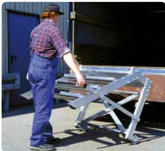
Abb. Best.-Nr. 50021