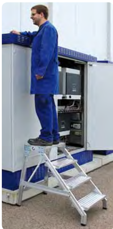
Abb. Best.-Nr. 50174