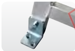
Abb. Best.-Nr. 50409