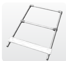
Abb. Best.-Nr. 50028