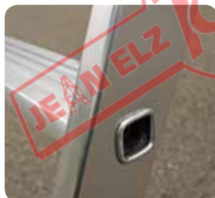
Gebördelte Stufen, 80 mm tief.