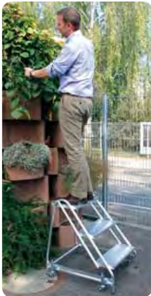
Abb. Best.-Nr. 50051 mit 4 St. Feder-Bremsrollen Best.-Nr. 50069