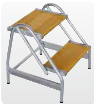
Abb. Best.-Nr. 50056