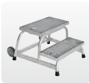
Abb. Best.-Nr. 51018