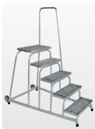
Abb. Best.-Nr. 51025