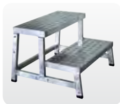
Grundmodul Best.-Nr. 50400