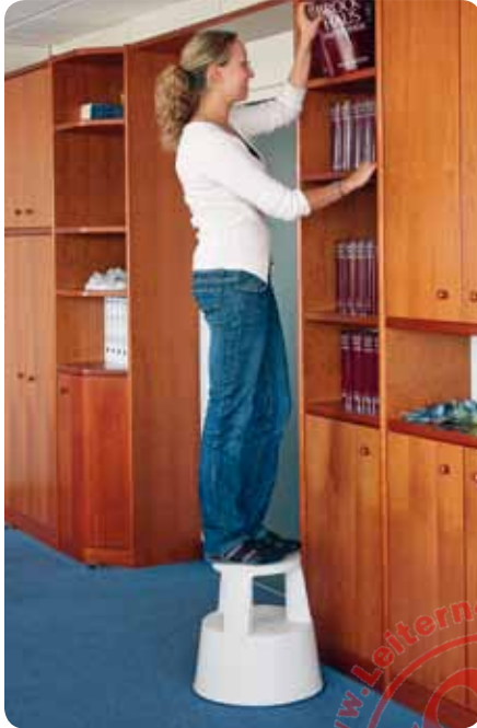
Abb. Best.-Nr. 50001

GS-geprüft, entsprechend europäischer Norm DIN EN 14183, Betriebsicherheitsverordnung (BetrSichV), TRBS 2121, Handlungsanleitung BGI 694 und geltenden Unfallverhütungsvorschriften