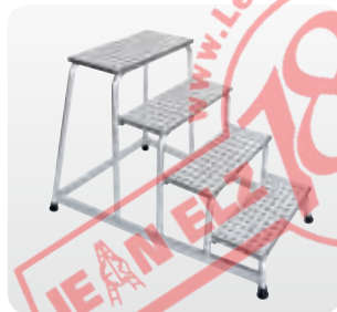
Abb. Best.-Nr. 50010