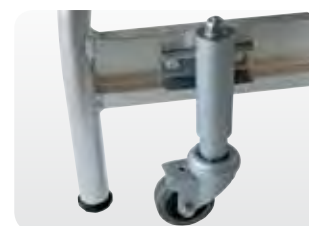
Abb. Best.-Nr. 50068/50069