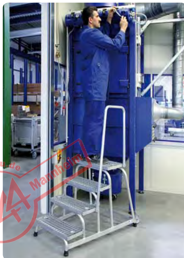
Abb. Best.-Nr. 51024