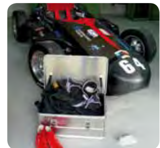
Abb. Best.-Nr. 11136